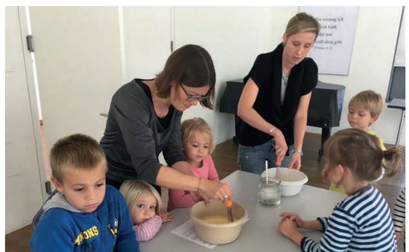
Impressionen vom Fiire mit Chliine

Dienstag, 14. November 20.00 Uhr, Katholische Kirche